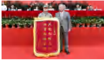
执行董陈坚德为教官团队赠送锦旗